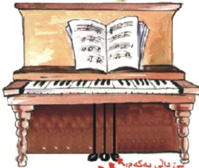
پین دالی یه که م: پین دالی دووه م: پین دالی سییه م:

پیانو نامیریکی روزنا واییه و بریتییبه له ( ۸۸ ) دهنگ. یه که مجار که دروستکراوه، ساده بووه پینان وتووه ( کلاقی سان ). پاشان که مینک په ری سه ندووه و ناوی گوپراوه به ( کلاقی کورد )، دواتر گورانکاری زیاتری به سهردا هاتووو ناو نراوه ( پیانو ). نه م نامیره بریتییبه له ( ۳ ) پین دال: پین دالی یه که م بو دهنگدانه وه ی دهنگه کان به کار دیت. پین دالی دووه م بو کپکردنی دهنگه کان به کار دیت. پین دالی سییه م بو فزم کردنه وه ی دهنگه کان به کار دیت. له پیانو ژه نه جیهانییه به ناو بانگه کان: فرانز لیست ( رومانیک )، فردریک شوپین ( رومانیک )، یوها سباستیان باخ ( کلاقی کورد، کلاقی سان ).