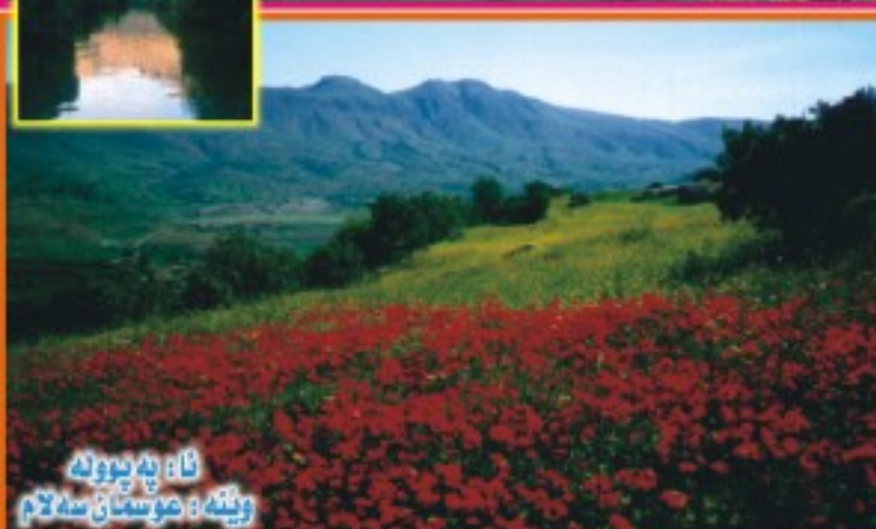
نا: په پووله وینه: عوسمان سه لام